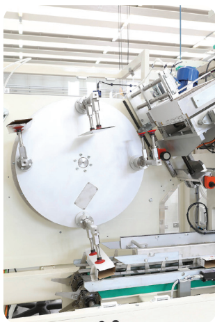
Il nuovo sistema di prelievo degli astucci è in grado di garantire un'alta prestazione delle macchine

L'azienda pistoiese è l'unico esempio nel settore a progettare, costruire e installare linee completamente automatiche garantendo lo svolgimento delle varie fasi di produzione esclusivamente all'interno delle proprie mura: dai sistemi di alimentazione alle bilance, dalle confezionatrici alle incartonatrici fino agli impianti di pallettizzazione. Leader di un mercato in cui una domanda crescente richiede performances e affidabilità sempre più elevati, Ricciarelli offre sistemi tecnologicamente avanzati, forniti di dispositivi unici e brevettati che assicurano il miglior trattamento possibile del prodotto e la sua tracciabilità. Tut-